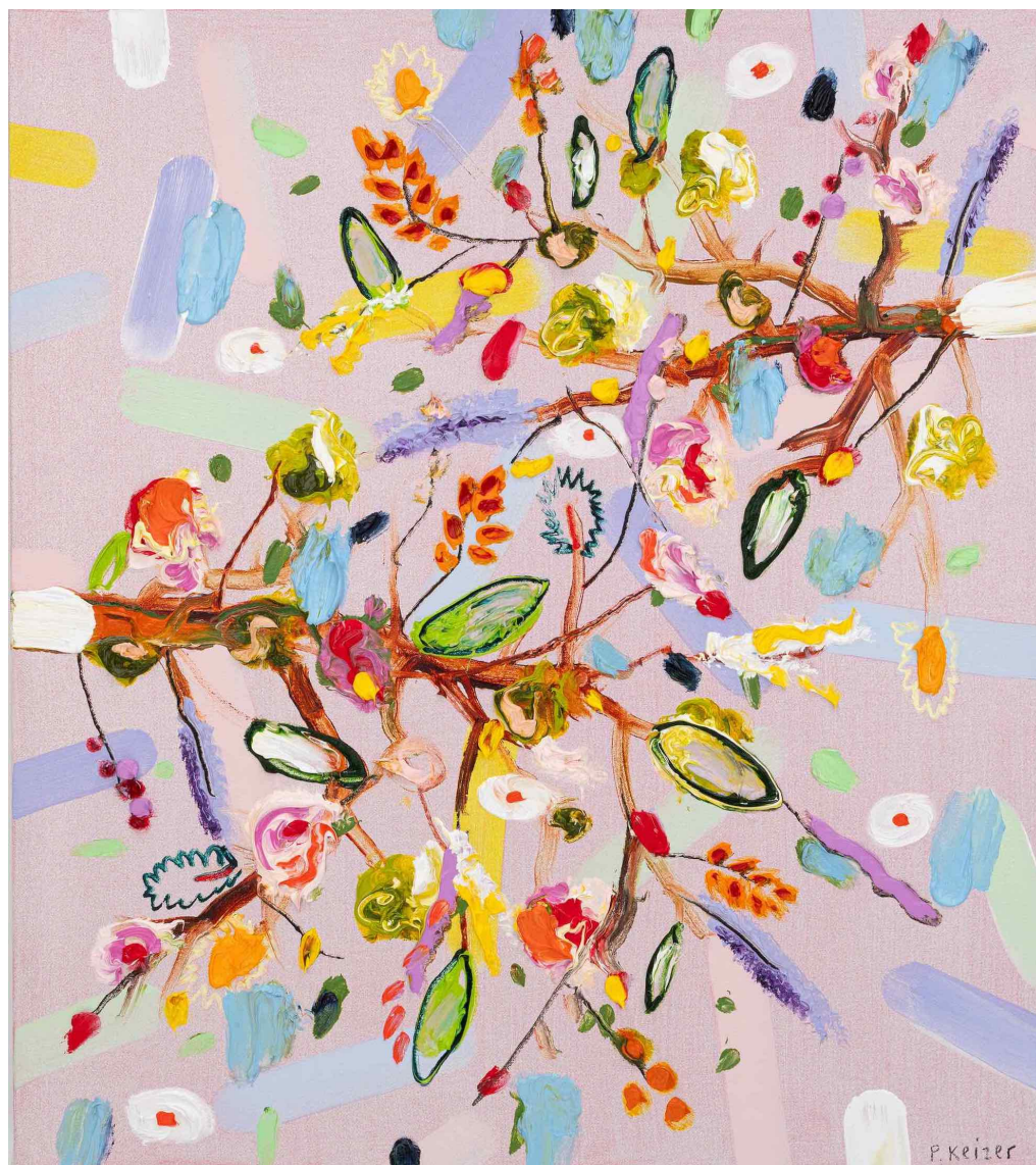
PETER KEIZER Mirror , 2025 Huile sur toile 72 x 64 cm Pièce unique Signé N° INV keip_589