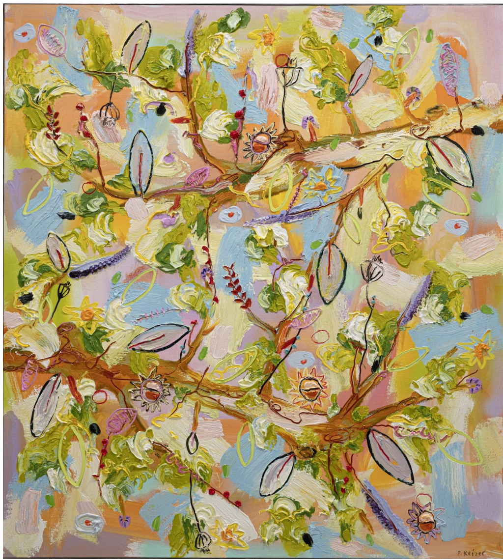
PETER KEIZER Saturday, 2025 Huile sur toile 124 x 112 cm Pièce unique Signé N° INV keip_625