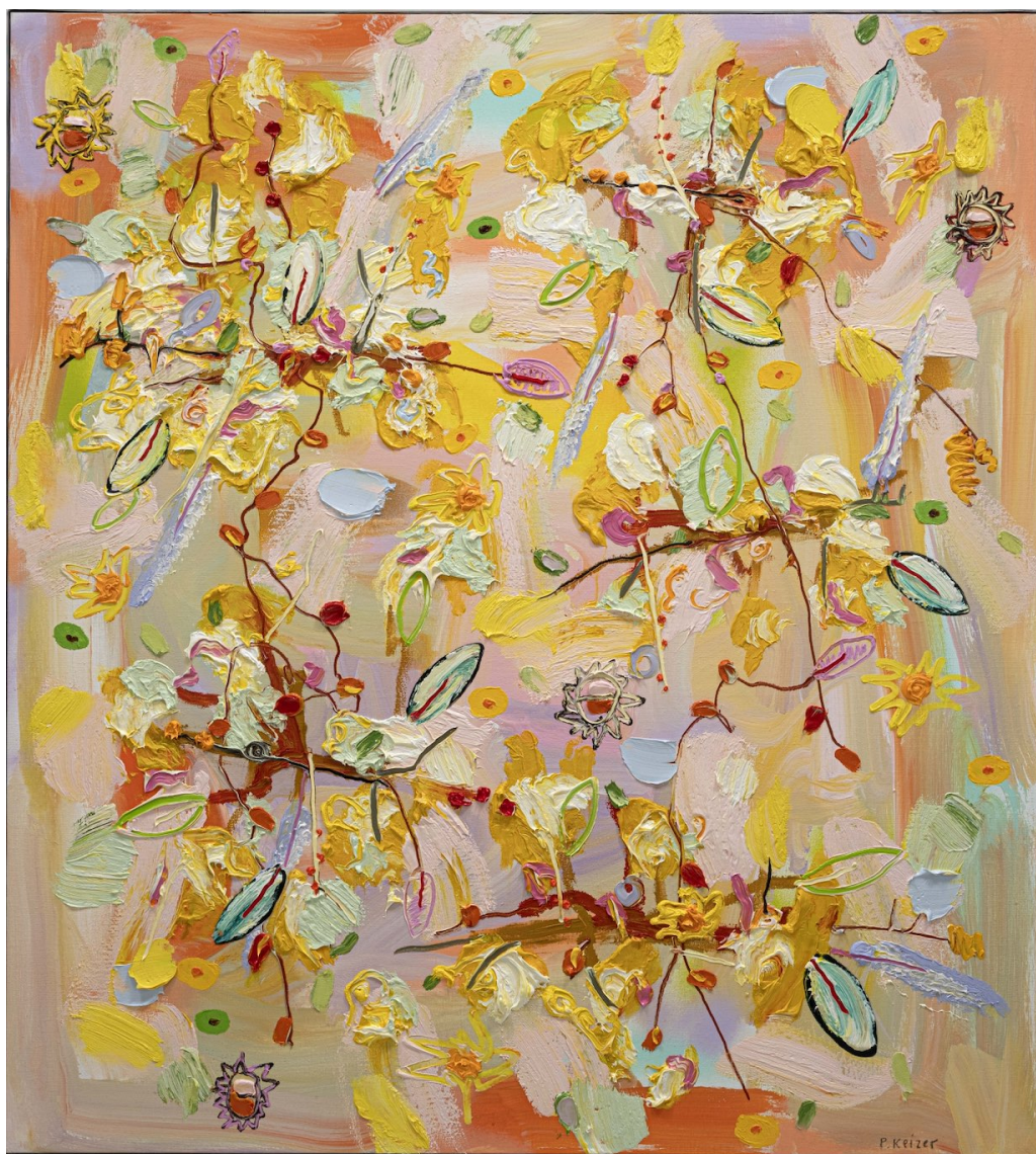
PETER KEIZER In August, 2025 Huile sur toile 124 x 112 cm Pièce unique Signé N° INV keip_626