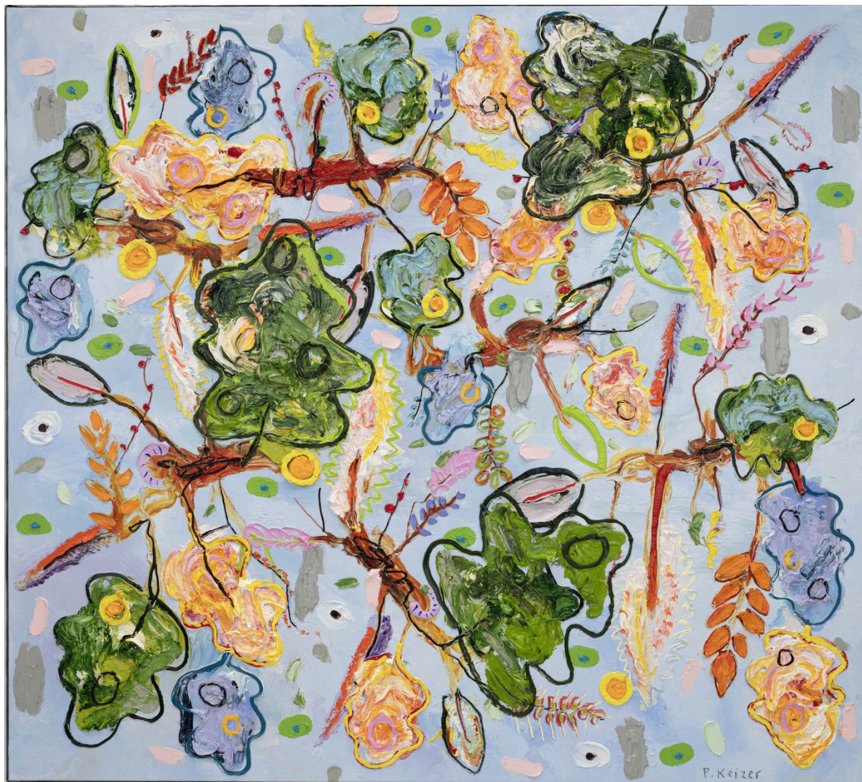
PETER KEIZER Foliage , 2025 Huile sur toile 112 x 124 cm Pièce unique Signé N° INV keip_602