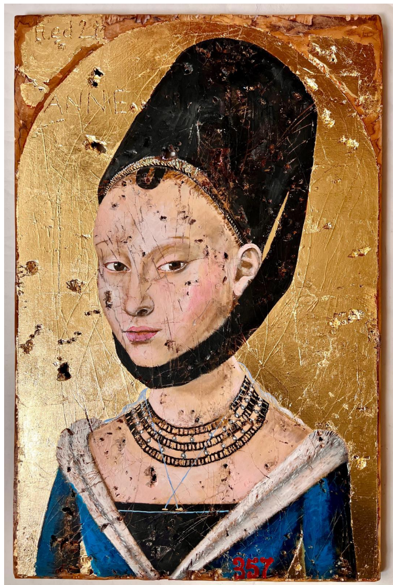
Anne Talbot, 2024 Acrylique sur bois, plexiglass 106 x 73 x 15 cm Pièce unique Signé N° INV ghij_026