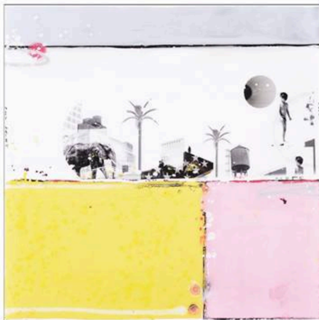
Ci-dessus : Dreamer , 2017. Pièce unique, 124 x 124 cm. Technique mixte.

Edouard Buzon : J'adore la photo, elle m'a toujours passionné. Mais ce n'est pas mon médium. J'ai besoin de m'appropriier les choses, les images et de le faire avec mes mains, armé des couleurs que je fabrique moi-même à partir de pigments. La photo n'est qu'une étape dans mon travail. J'organise des rencontres improbables entre des éléments visuels qui ne pourraient pas se croiser dans la vraie vie, et je les intègre dans des paysages plus abstraits orchestrés par des aplats de peinture. Quant aux humains et aux animaux, ils se présentent toujours de dos afin que celui qui regarde ait toute liberté pour identifier ces créatures.