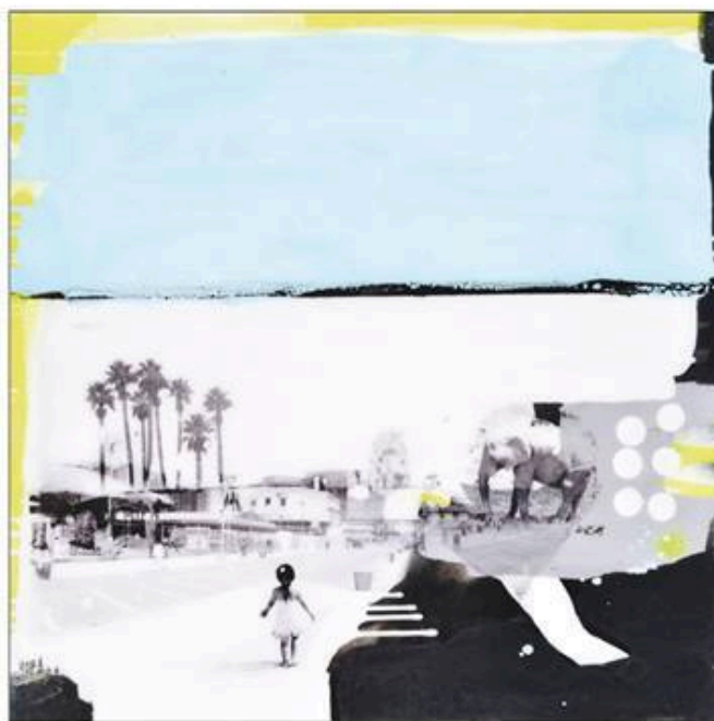
Ci-dessous : Enjoy , 2017. Pièce unique, 74 x 74 cm. Technique mixte.