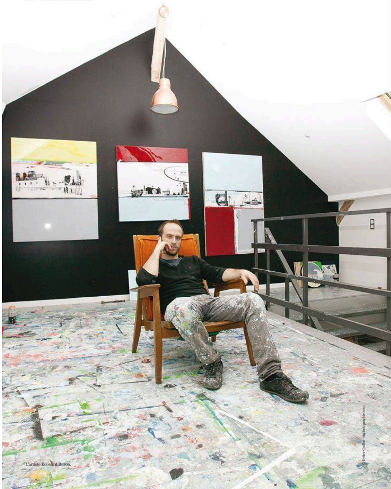
L'artiste Edouard Buzon.