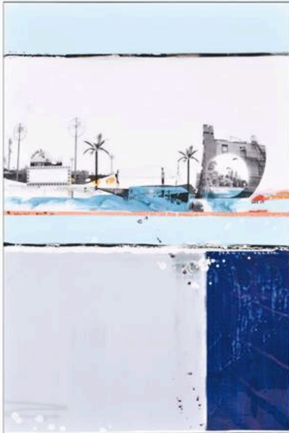
Magic Island , 2017. Pièce unique, 150 x 100 cm. Technique mixte.